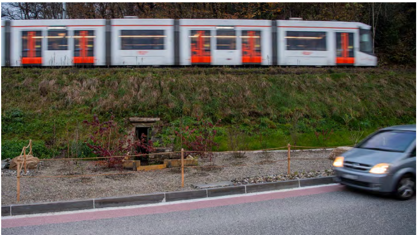
C'è già un pertugio.